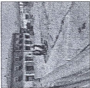
Scavi in piazza Pertini

GAMBETTOLA. Un pozzo, pezzi di anfore e vasi: dopo i pavimenti riaffiorano altri reperti del "Palazzone". In piazza Pertini durante i lavori di riqualificazione del centro storico sono venute alla luce le prime importanti testimonianze di palazzo Pilastrini-Saladini. Ora gli scavi proseguono sereni sotto l'occhio attento degli archeologi nominati dal Comune e la collaborazione della Soprintendenza dei beni culturali e archeologici.