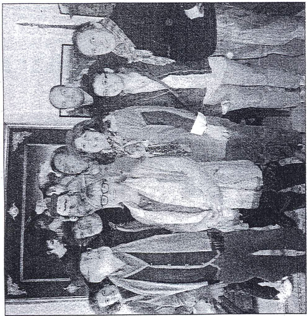
La presentazione del teatro scolastico