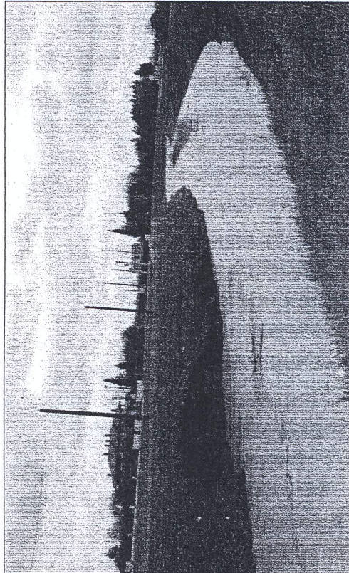
Il Rubicone gonfio d'acqua dopo le precipitazioni

Stasera all'ex macello assemblea annuale dei soci dell'associazione 360 su nuove attività del circolo, raccogliere proposte e adesioni per una partecipazione più attiva.