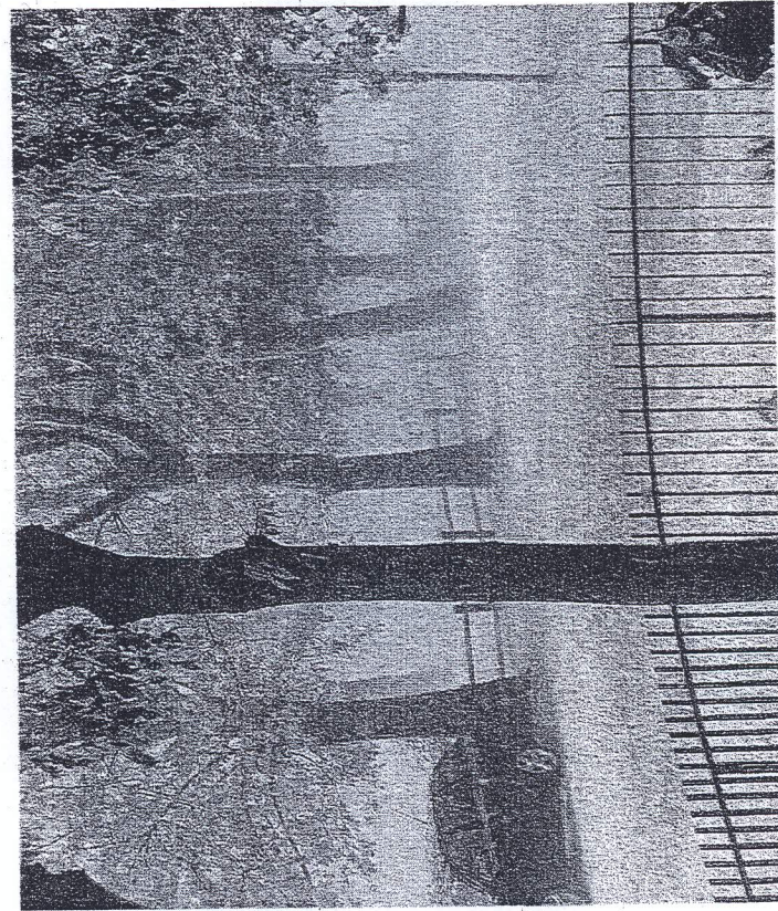
Grandine ieri pomeriggio si è abbattuta per mezz'ora in zona devastando le colture

U na violenta grandinata si è abbattuta nel pomeriggio di ieri sul territorio del Rubicone e precisamente nelle zone costeggiate a valle e a monte della via Emilia. Da Gambettola, a Longiano, da Borghi a Savignano, strade e campi sono stati invasi dalla grandine che si è abbattuta per una trentina di minuti. Alcuni chicchi hanno raggiunto anche il diametro di circa un centimetro. Una precipitazione disastrosa in questa fase stagionale che provoca danni irreversibili alle coltivazioni agricole come le piante da frutto che si trovano in piena fioritura e alle verdure in campo. Per cercare di limitare i danni, alcuni agricoltori della zona hanno continuato a sparare verso il cielo per cercare di proteggere le colture, sperando così di riuscire a "spezzare" le correnti di aria fredda e calda che si stavano scontrando. Ma la vecchia "usanza" è servita a poco perché il panorama che si è presentato era desolante. Strade, campi, giardini erano coperto da uno strato bianco di ghiaccio. A far la