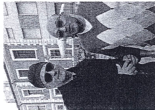
RICORDO Roberto Baggio con Claudio Gentile de 'Il Punto'

È ARRIVATO all'alba con il volto nascosto dietro a un paio di occhiali da sole. Ma qualcuno lo ha riconosciuto e non ha perso l'occasione di farsi immortalare con l'idolo di molti. Ieri alla Mostrascambio di Gambettola ha fatto visita, a sorpresa, Roberto Baggio, diretto alla Fiera del fitness a Rimini. Erano le 5,25 quando Baggio si è presentato al bancone del bar Ciambellino e ha fatto colazione insieme a due amici. Immancabile la foto di rito col titolare. Poi, alle 7,30, il popolare calciatore è stato riconosciuto tra i visitatori, alla ricerca di alcune stampe antiche. E Claudio Gentile, della tipografia 'Il Punto' di Gambettola, si è fatto scattare pure lui un paio di foto con Baggio.